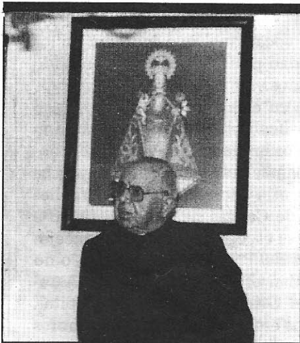
Covadonga consternada: No vino el Papa, . . . . . pág. 13

Niños que viven alejados de su hogar; niños como los de Vis, que han de hacer diariamente largas marchas en la poco amable climatología invernal de nuestra tierra; niños que tienen derecho a recibir una enseñanza digna; presupuestos que no alcanzan para disponer de personal e infraestructura necesarios; planes de enseñanza que exigen una docencia especializada; rico, extenso, enorme caudal de cultura que hay que transmitir; apego del hombre a su tierra.