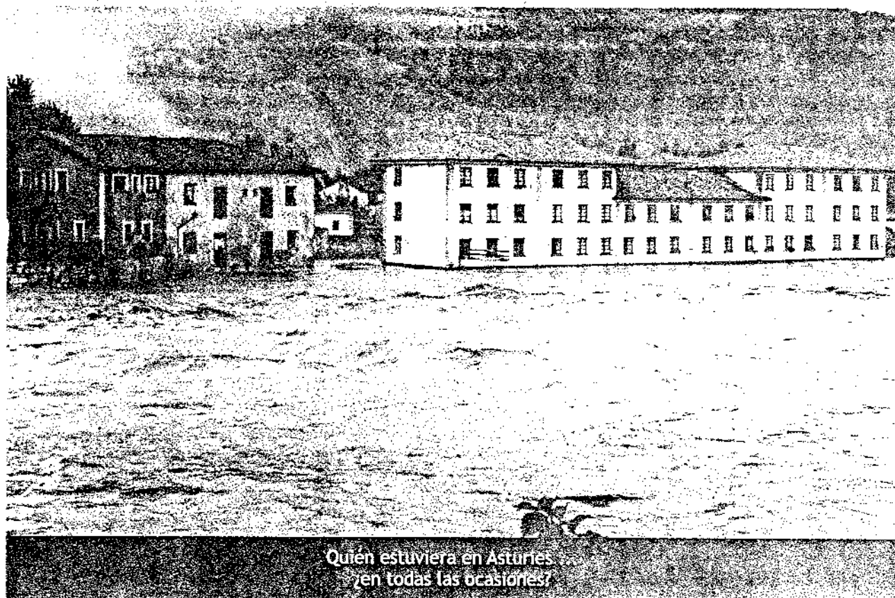
Quien estuviera en Asturias en todas las ocasiones?

los Circos Mundiales (mucho más artísticos y grandiosos que los que últimamente nos visitan). Y a los Teatros, que hacían estancias de un mes llenando a diario con exitosas comedias (Paso), sainetes (Hermanos Quintero), tragedias del gusto más popular y tremendista (Benavente), ó Vodeviles picantes y populistas, de autor olvidable pero de carcajadas desaforadas ( Enchúfame la goma, butanero ).